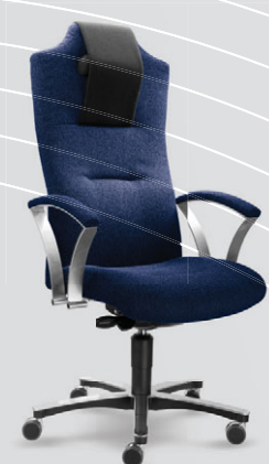
modročerná 24 001