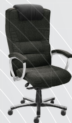
zelenočerná 24 012