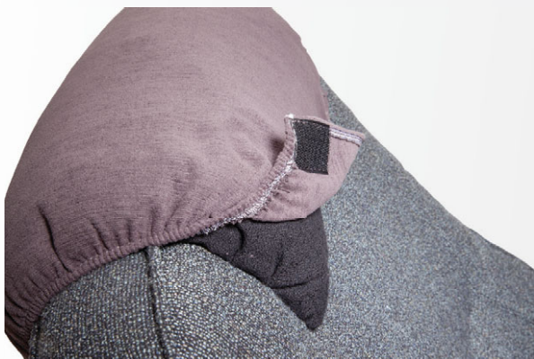
HNH - hygienické návleky na hlavové opěrky