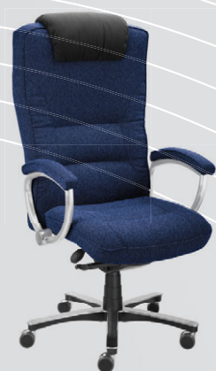
modročerná 24 001