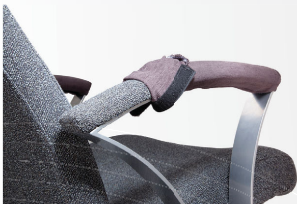
HNA - hygienické návleky na pevné područky