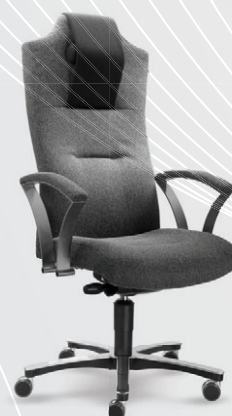
šedočerná 24 002