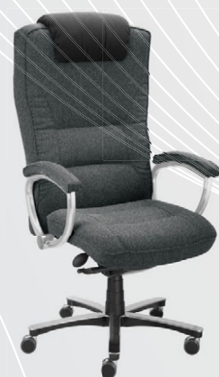
šedočerná 24 002