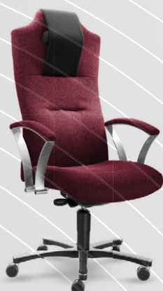
červenočerná 24 008