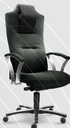
zelenočerná 24 012