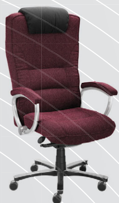
červenočerná 24 008