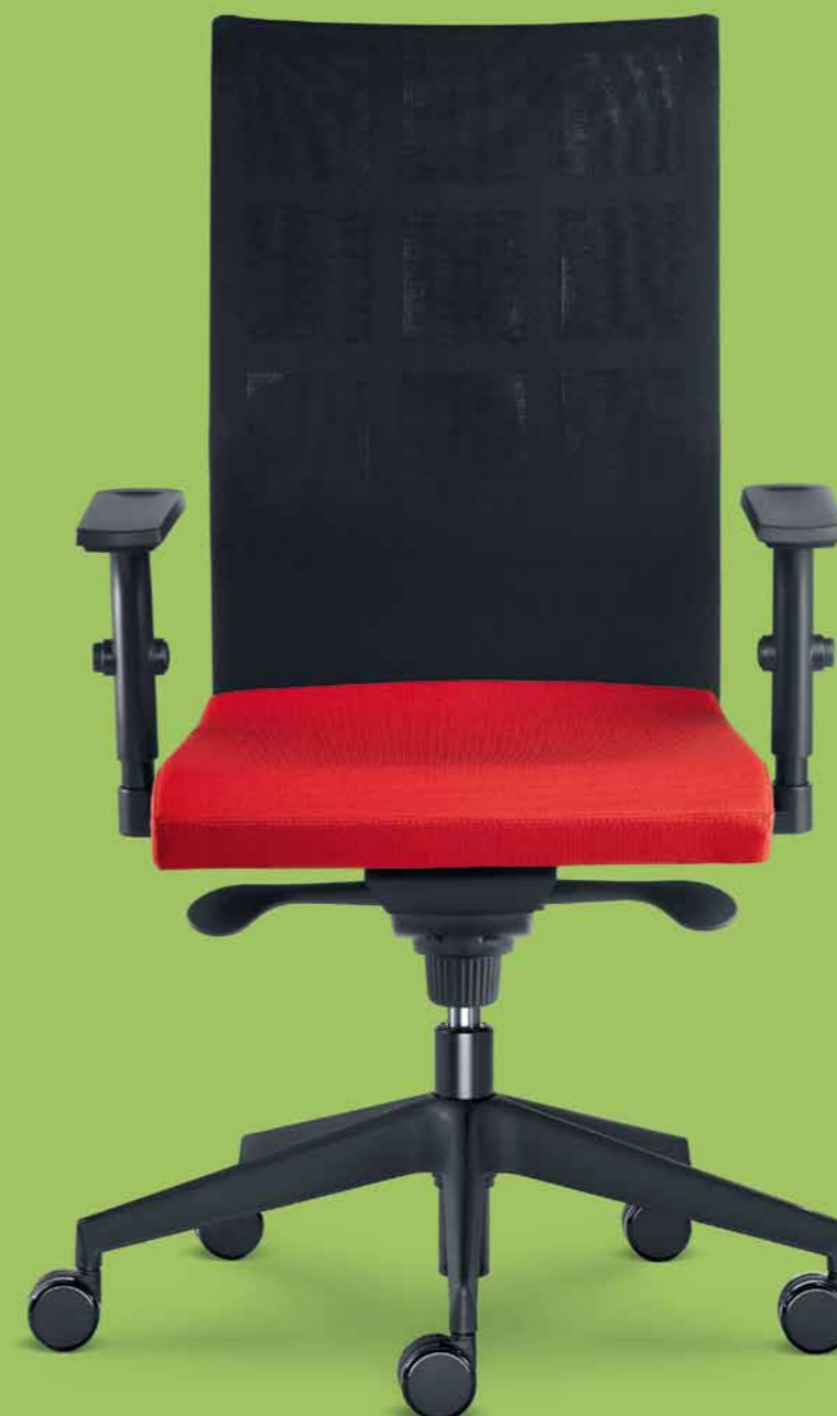
400-SY ■ + BR-470-N1

Web conference chairs are very comfortable for short and long-term sitting thanks to the upholstery and a "spring" steel frame.