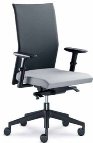
410-SYS ■ + BR-470-N1