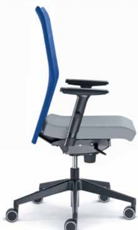
410-SY ■ + BR-470-N1