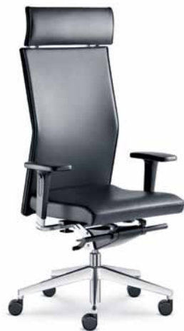
420-TI ■ + BR-550-N6