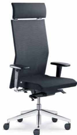
425-TI ■ + BR-550-N6