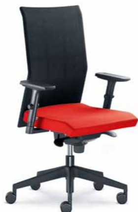
400-SY ■ + BR-470-N1