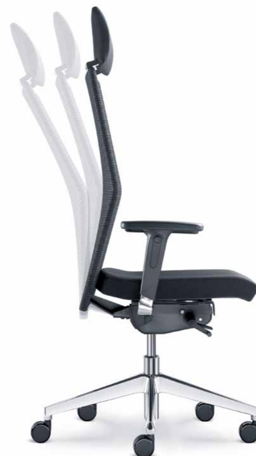
425-SYS ■ + BR-550-N6

Backrest angle setting and its synchronous motion with the chair seat, height-adjustable seat and optional adjustable functions such the seat depth or angle setting independent of the mechanism movements are provided as a matter of course.