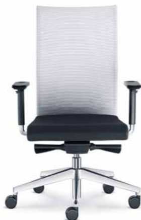
405-AT ■ + BR-209-N6