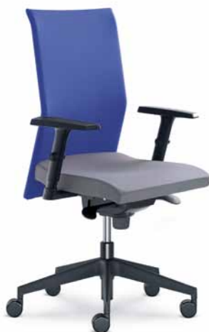
410-SY ■ + BR-470-N1