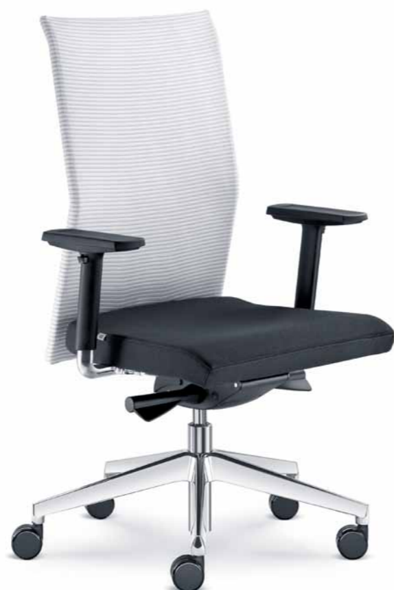
405-AT ■ + BR-209-N6