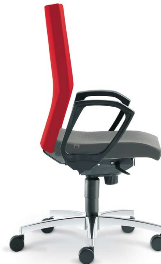
472-SY + BR-472