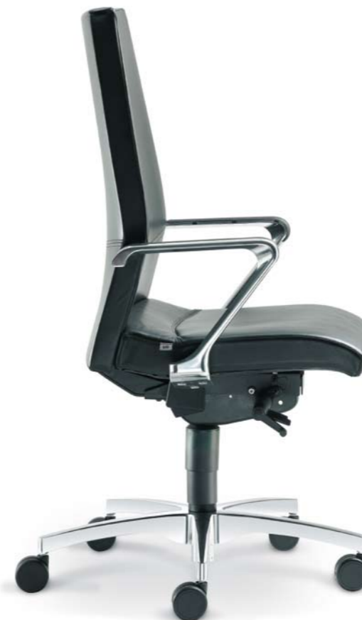
470-SYS + BR-450-N6