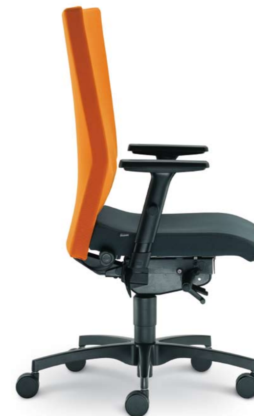
470-SYS + BR-236-N1