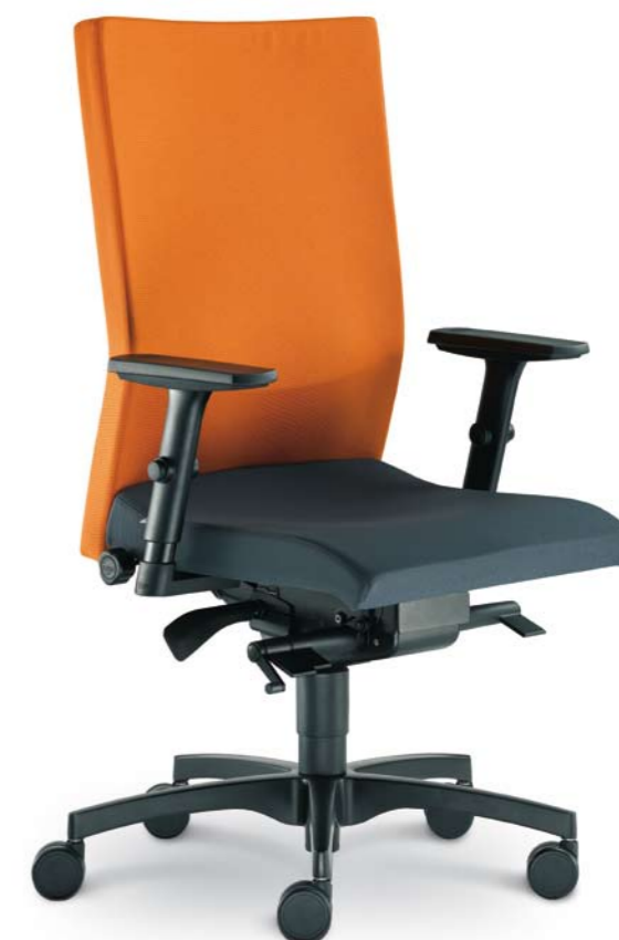
470-SYS-PN-BO + BR-236-N1

Die Kopfstütze bei Lextra ist ein angenehmes Entspannungs- und ergonomisches Ergänzungstück. Man kann sie dank den Einstellungsmöglichkeiten der geforderten Höhe sowie des Winkels dem Benutzer hervorragend anpassen.