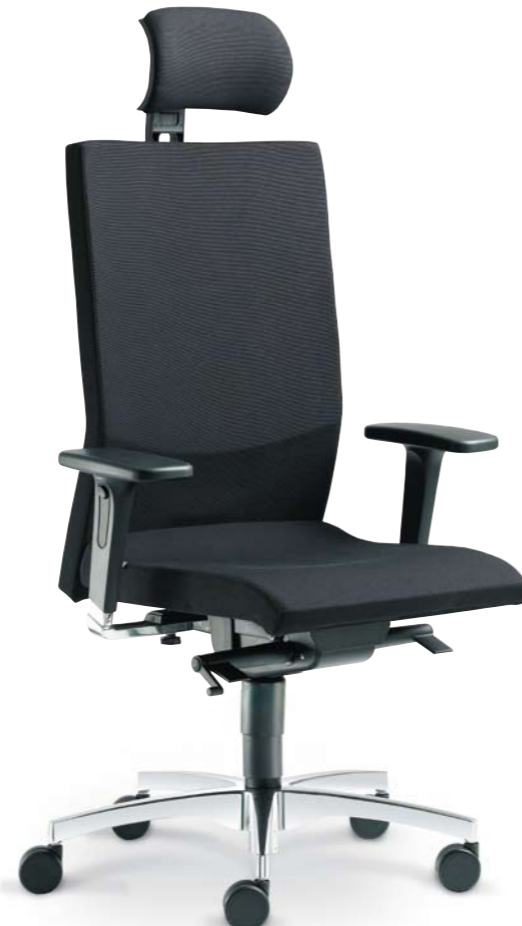
480-SYS + BR-550-N6