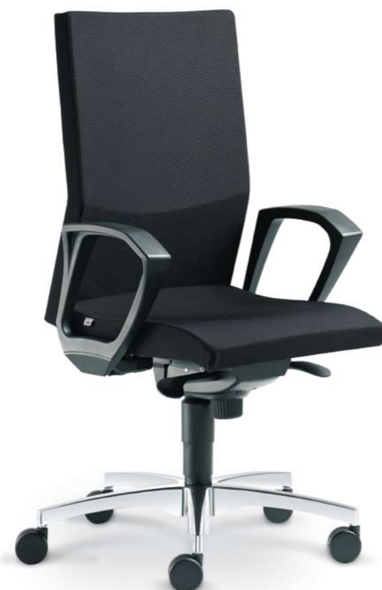
472-SY + BR-472

Lextra ist ein Stuhl, der dazu vorbestimmt ist, zur idealen Wahl für viele Benutzer sowie Interieure zu werden. In seiner Klasse repräsentiert er die Spitze in der einzigartigen Verbindung von Eleganz, Design, Ergonomie, Nutzwert, Zuverlässigkeit und Preis. Die ideale Wahl von vielen Blickwinkeln aus. Das ist das Ergebnis und so war auch der erste Gedanke. Es ist selbstverständlich, dass der Benutzer durch die Auswahl aus einer Reihe von optionalem Funktionszubehör seinen Lextra genau nach seinen Anforderungen ergänzt.