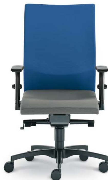
470-SYS + BR-236-N1