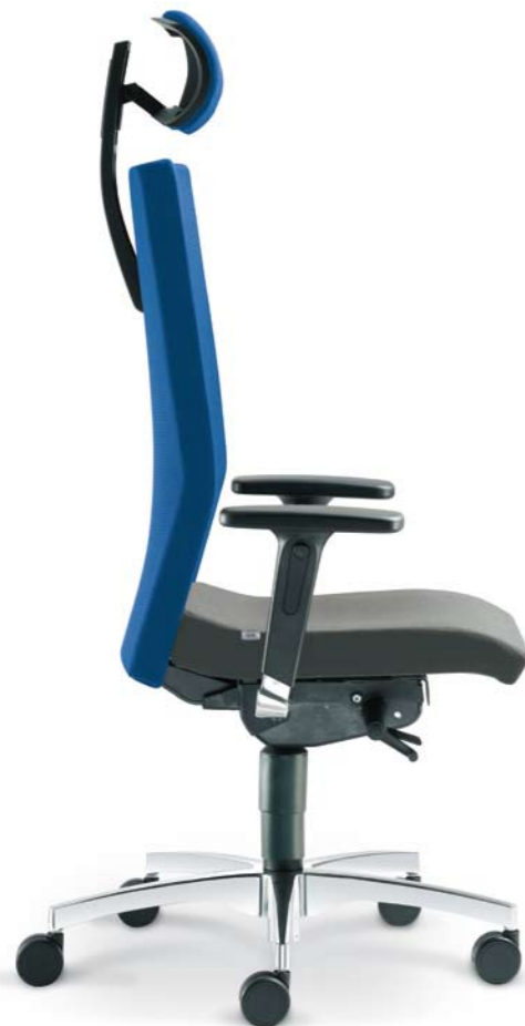
480-SYS + BR-550-N6

Die ergonomisch geformte höhenverstellbare vollgepolsterte Rückenlehne erfüllt gemeinsam mit dem ergonomisch geformten Polstersitz und dem Synchronmechanismus in perfekter Weise die richtige Ergonomie des Sitzens und die Anforderungen an gesundes Sitzen. Der Synchronmechanismus kann auch mit einer unabhängigen Einstellung des Sitzwinkels ergänzt werden. Der Sitz des Lextra kann auch mit einer Sitztiefeverstellung ausgestattet werden.