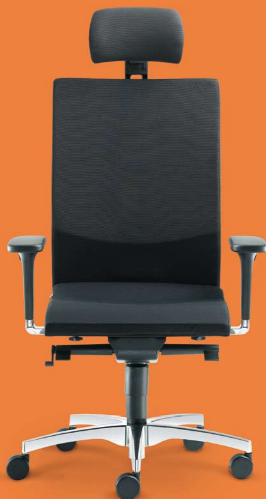
480-SYS + BR-550-N6