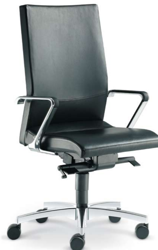
470-SYS + BR-450-N6